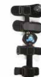
1 attelle articulée