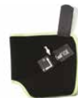
1 pack de froid