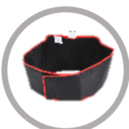
Enveloppe dos/poitrine/hanche Code : E6-M Taille : 1220*305 mm Poids (g) : 295