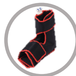
Enveloppe cheville/pied Code : A6-M Taille : 725*375 mm Poids (g) : 275