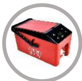
Contrôleur CRYO NOV Code : KRP/MYY-(M)