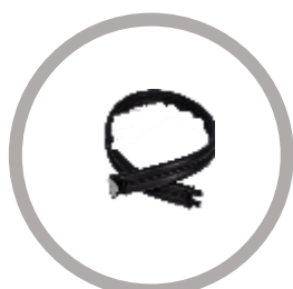
Tuyau à double connecteurs Code : KRP/MYY- 1