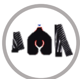
Enveloppe universelle Vétérinaire Code : TY-M Taille : 290*360 mm Poids (g) : 140