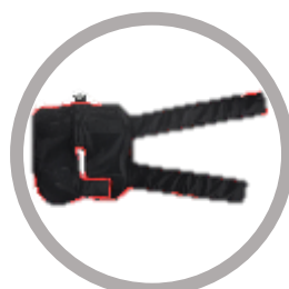
Enveloppe genou Code : H6-M Taille : 835*345 mm Poids (g) : 245