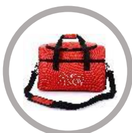
Sac de transport Code : KRP/MYY - 2