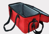
Sac de transport Code : KRP/MYY - 2