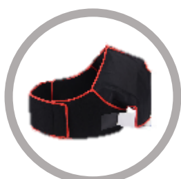
Enveloppe d'épaule Code : B6-M Taille : 965*465 mm Poids (g) : 260