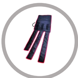
Enveloppe de cuisse Code : C6-M Taille : 895*365 mm Poids (g) : 260