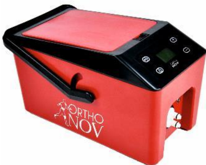
Contrôleur CRYO NOV Code : KRP/MYY-(M)

CRYO NOV est conçu pour vous aider dans votre récupération par le flux intermittent d'eau froide dans une enveloppe adaptée. Idéal après une séance de sport !