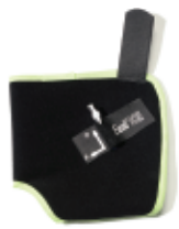
1 cold pack