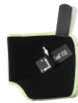
1 pack de froid