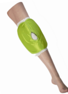
4 - Placer la poche antérieure par dessus le jersey, sur votre genou.