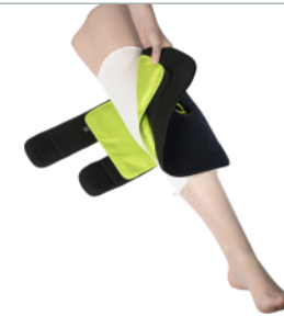
5 - Placer l'attelle sur votre genou et passer les bandes derrière la jambe.