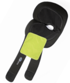
3 - Positionner la poche de froid postérieure sur l'attelle.