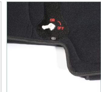
9 - Fermer le robinet sur la position «OFF» et dévisser la pompe de gonflage.

Dégonfler l'attelle après chaque utilisation.