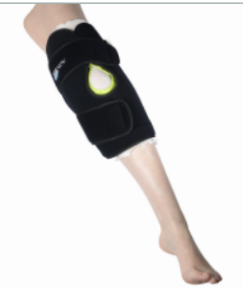
6 - Positionner la sangle inférieure puis placer la sangle supérieure et resserrer si besoin.