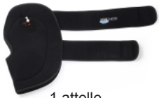
1 attelle de cryothérapie