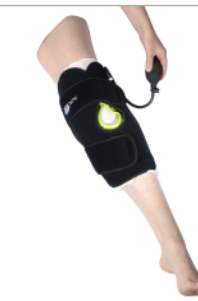
8 - Exercer 10 à 15 pressions. Stopper quand la pression est suffisante et confortable.