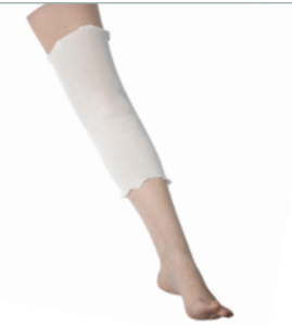
2 - Mettre le jersey de protection sur la jambe.