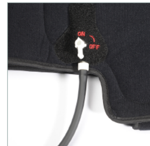
7 - Visser la pompe, positionner le robinet sur «ON».